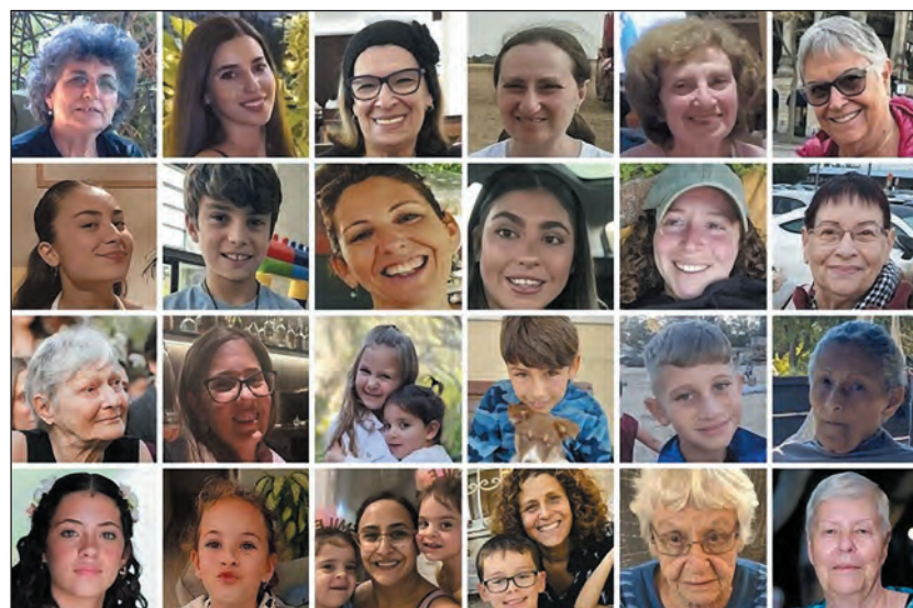
A még mindig fogságban lévő túsok egy csoportja

A dokumentum szerint a Gázai övezet középső részén 25 túszt tartottak fogva, köztük hat aktív katonát, tizenkét tartalékost, akik közül a legidősebb 53 éves, és hét fiatal, 21 és 27 év közöttiek. Rafahban, legalábbis e jelentés szerint, két 60 év feletti férfi és négy beduin (egy 55 éves, a többi 18 és 22 év közötti) volt. A gázai körzetben hat katona, egy katonanő, három tartalékos, négy fiatal, egy 66 éves férfi és egy beduin volt. A dokumentum szerint összesen 71 túszt tartottak fogva.