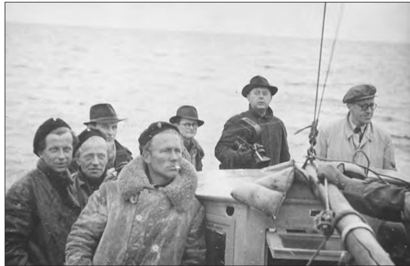
Svédország. Az Oresund szoroson keresztül menekülő dán zsidók