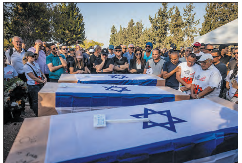
A Beeri kibucban meggyilkolt Sarabi család tagjainak temetése

A Hamász Izrael elleni, október 7-én elkövetett véres terrortámadása és a nyomában kitört háború az elmúlt egy évben 885 civil áldozatot követelt Izraelben az állami Nemzeti Biztosító most nyilvánosságra hozott adatai szerint. A 885 halálos áldozat közül 581 volt férfi, 304 nő. 53 áldozat volt 18 éven aluli, közülük négy 0 és 3 év közötti gyerek, ketten 3 és 5 év között, hár-