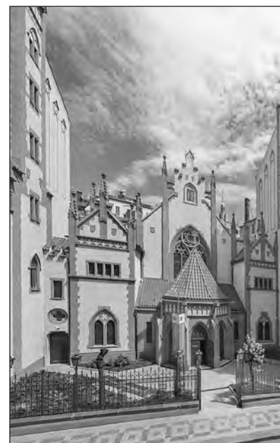
Csehország. A prágai Zsidó Múzeum a bársonyos forradalmat követően visszatérhetett eredeti tevékenységéhez