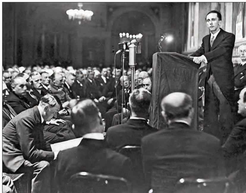
A propaganda mellett a sajtót, a színházakat és a zenét is irányította

A nácik hatalomra jutása után Goebbels átvette az országos propagandagépezet irányítását. Létrehozták számára a Német Birodalmi Közmegvilágosodási és Propagandaügyi Minisztériumot, és ő lett az újonnan